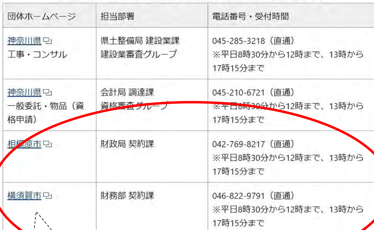
参加団体ホームページ・競争入札参加資格申請手続き審査担当連絡先

かながわ共同入札システムの参加団体ホームページへのリンクと、競争入札参加資格申請手続きに関するお問い合わせ先です。